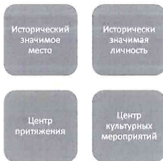
Рис. 1. Основания социокультурной инфраструктуры