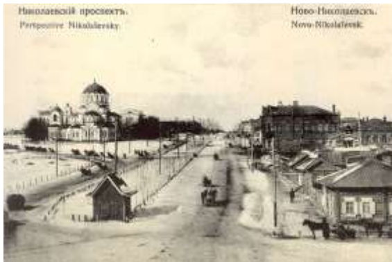
Николаевский проспект, Республика Новосибирск