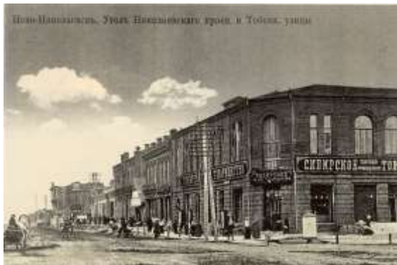
Ново-Николаевский, Угол Николаевского пр-да, в Тобольск-улице