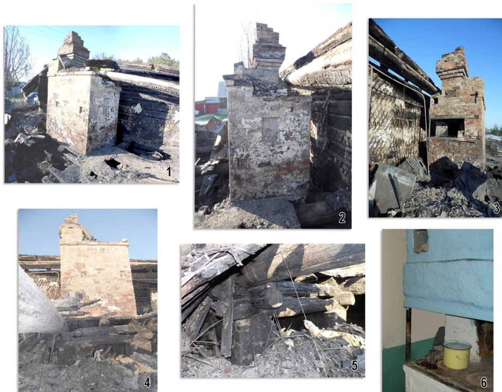
Ил. 3. ПМА. Ул. Дачная, 32. Следы огня внутри дома (1–3 — на уровне пола, у печи; 4–5 — ниже уровня пола, у печи; 6 — для сравнения: состояние печи до пожара).

Пожар в доме изменил до неузнаваемости привычную планировку. Ориентироваться в пространстве для поиска вещей пришлось по оконным проемам. В огне уцелели небольшие предметы, находившиеся на полу или не высоко от него, так как оказались в короткое время погребены под слоем шлака и другого мусора. Поэтому in situ на полу были обнаружены припрятанные посуда, столовые приборы; документы и ордена, спрятанные в жестяной ящик и т.п.