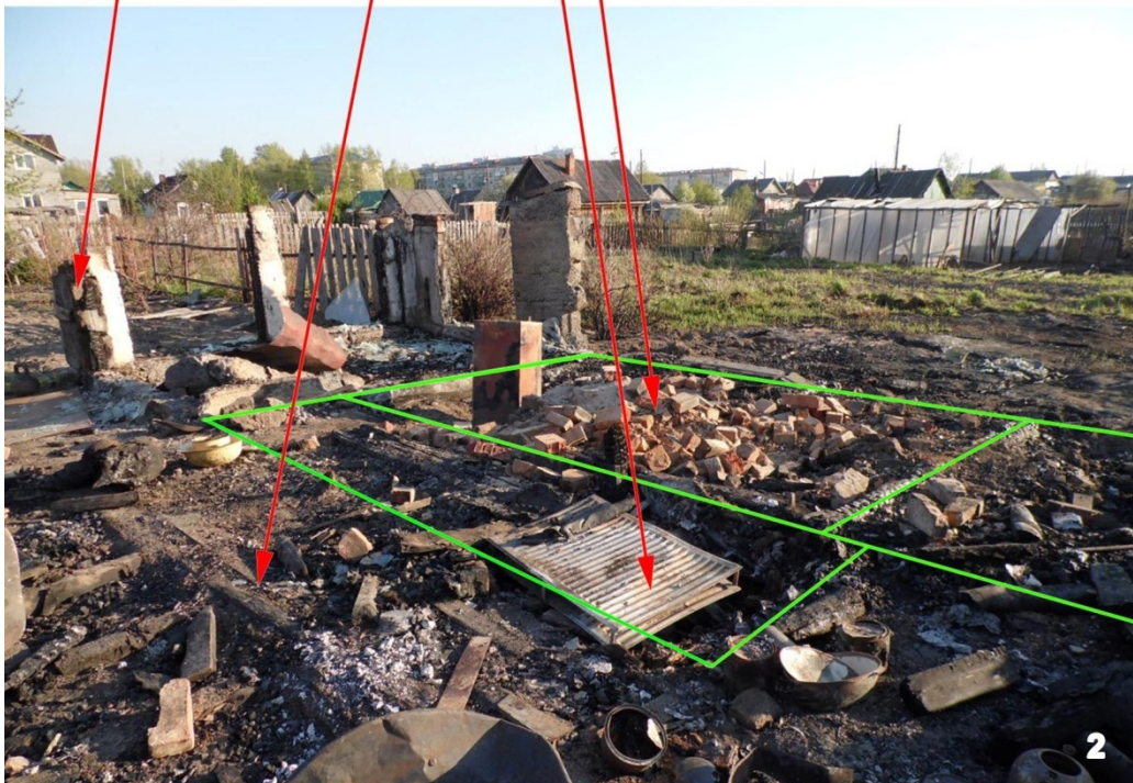
Ил. 4. Ул. Дачная, 32. Сопоставление расположения надворных построек до (1) и после (2) пожара (стрелками отмечено: А — теплица, Б — тротуар, В — летний туалет, Г — развал печи бани). Fig. 4. St. Dachnaya, 32. Comparison of the location of outbuildings before (1) and after (2) the fire (arrows indicate: A — greenhouse, B — sidewalk, C — summer toilet, D — collapse of the bath stove).