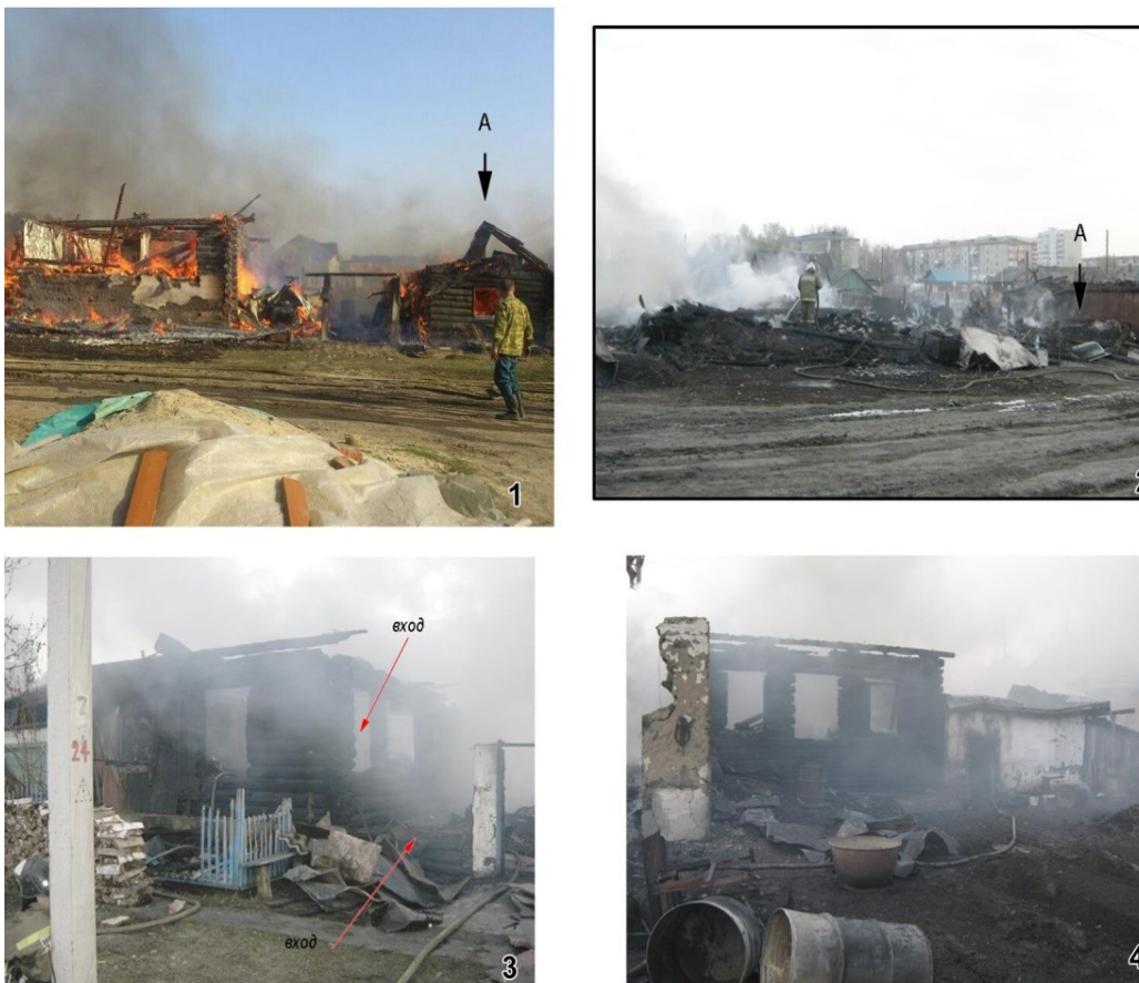
Ил. 2. ПМА. Постройки в процессе горения (1, 2 — центр пожара по ул. Дачная, 30 (А — источник пожара (баня)). Вид с улицы; 3 — дом по ул. Дачная, 32. Вид с улицы; 4 — дом по ул. Дачная, 32. Вид с юга).

На данном примере остановимся более подробно, так как процесс горения, тушения, разборки завалов нами фиксировался более детально, чем на соседних участках. На доме №32 сначала загорелась крыша, которая после прогорания стропильных конструкций сложилась внутрь чердачного пространства. Чердак для тепла был засыпан угольным шлаком — распространенным и дешевым утеплителем. После «разгерметизации» помещения из-за лопнувших оконных стекол, а также прогорания чердачного перекрытия, огонь начал активно проникать внутрь помещения.