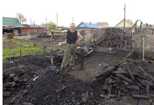
Ил. 5. ПМА. Ул. Дачная, 32. Хозяйственная постройка (хлев) (1 — в процессе тушения, 2 — в процессе расчистки).