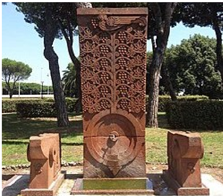
Ил. 11. Памятник-родник в память о дружбе Еревана и Каррары, Италия, Каррара. Интернет-ресурс https://ieinternships.blogspot.com/2014/02/normal-0-14-false-false-false.html