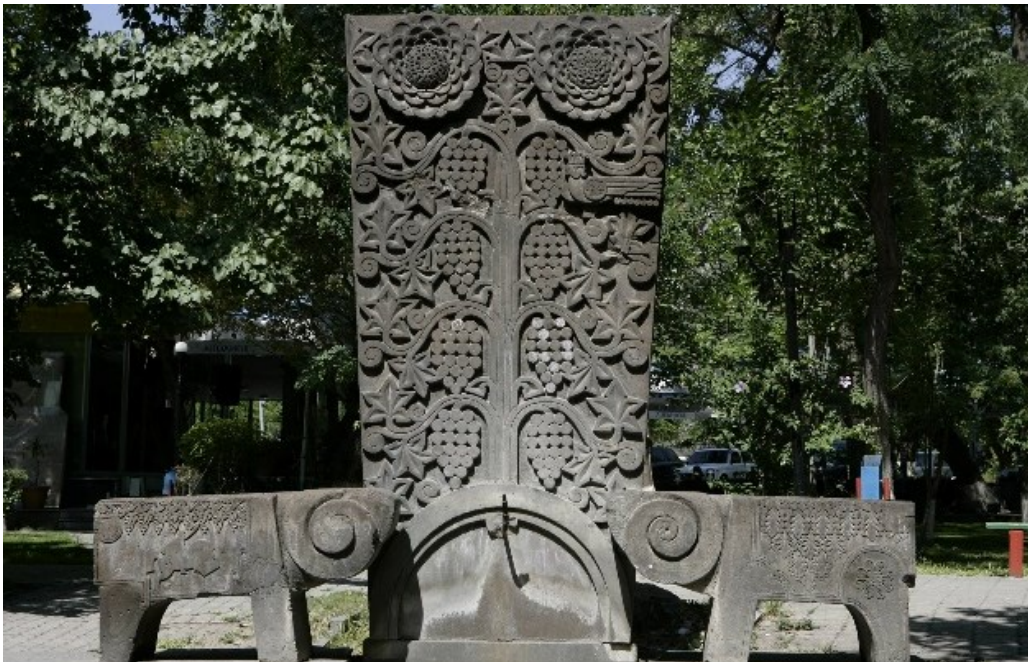
Ил. 10. Памятник-родник в Кольцевом бульваре Еревана. Интернет-ресурс https://ieinternships.blogspot.com/2014/02/normal-0-14-false-false-false.html Fg. 10. Memorial fountain in the Circular park in Yerevan. Internet source https://ieinternships.blogspot.com/2014/02/normal-0-14-false-false-false.html

Еще один родник из туфа Израеляна находится в Карраре, в Италии, в память о дружбе городов-побратимов Ереван и Каррара. В концепции памятник похож на родник в Кольцевом парке, но здесь виноградные грозди расположены более систематично и симметрично, а овны, кажется, охраняют памятник (ил. 11). Принцип композиции последнего памятника Рафаэля Израеляна аналогичен парадному убранству церкви Ахтамарского монастыря.