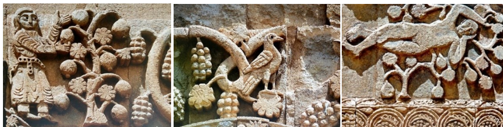
Ил. 5, 6, 7. Орнаменты Ахтамара, X в. Кюркчян А., Хачерян Г., Армянское искусство орнамента Fig. 5, 6, 7. Ornaments of Akhtamar, X c. Kyurkchyan A., Khacheryan H., Armenian Ornamental Art

Однако особенно уникальна роль виноградных декоративных убранств в храме Св. Креста в Ахтамаре. Мотивы винограда также навеяны светскими событиями, что отличает интерпретацию художественного убранства храма в реальности X века. В художественно-композиционных украшениях Ахтамарского храма человек, стоящий рядом с сплетенными вместе гранатово-виноградными деревьями, кажется, овеян долголетием, которое символизировано последними, наслаждается разнообразием земных и небесных благ. Однако на стенах монастыря можно увидеть не только сцены, но и художественные элементы, ставшие историческими символами, такие как птица и грозди винограда. Последние выполнены в виде изящных композиций, смягчающих величественную каменную композицию храма Ахтамар (ил.5,6,7) [Кюркчян, Хачерян, 2010, с. 73, 80, 90]. Однако, как барельефы животных, так и виноградов потерпели немало на себе временных и погодных последствий из-за своей выпуклости.