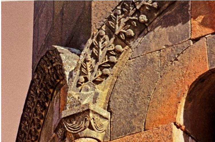
Ил. 3. Орнаменты Птгнванка. Fig. 3. Ornaments of Ptghnavank.

Собор расположен недалеко от города Еревана, по дороге в город Вагаршапат (г. Эчмиадзин).