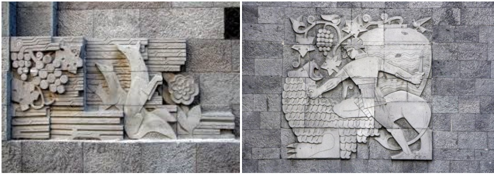
Ил. 8, 9. Орнаменты погребов Араратского винного треста, Р. Израелян. Fg. 8, 9. Ornaments of the cellars of the Ararat wine trust, R. Israyelyan.

Один из замечательных архитектурных творений Израеляна — памятник-родник, расположенный в одном из парков Кольцевого бульвара, так же украшен элементами гроздей винограда. Памятник представляет собой вертикальную композицию, в нижней части которой симметрично с обеих сторон родника размещены овны, своими рогами, как бы, удерживающие композицию родника. По всей длине памятника тянется орнамент с гроздьями винограда, который в нижней части резюмируется с самим источником. Именно сцена пользования овнов живой водой этого источника символизирует плодородие и долголетие. Источник отражает сдержанную, в то же время красноречивую художественную сущность