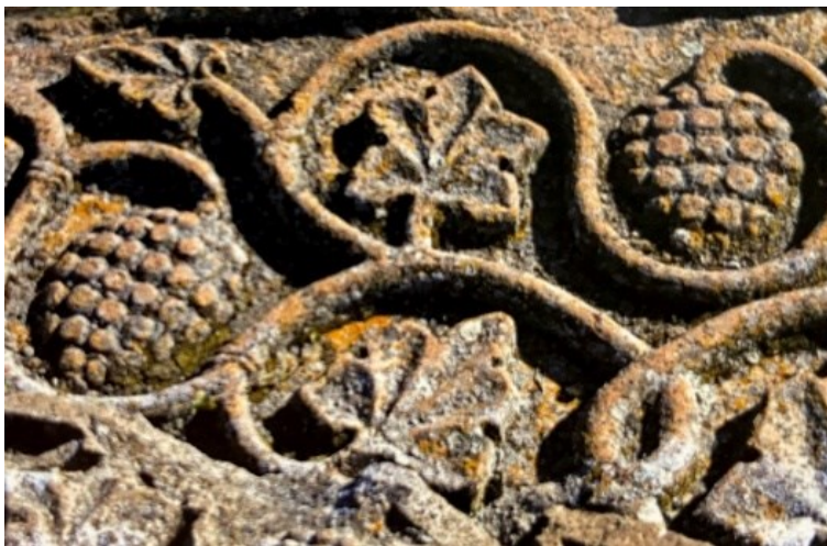
Ил. 4. Орнаменты Звартноца, VII в., Кюркчян А., Хачерян Г., Армянское искусство орнамента Fig. 4. Ornaments of Zvartnots, VII c., Kyurkchyan A., Khacheryan H., Armenian ornamental art

По словам армянского историка Себеоса, Звартноц был построен в 640–650 годах при католикосе Нерсесе III Строителе, который намеревался перенести свою резиденцию из города Двина в город Вагаршапат. Примечательно то, что на церемонии освящения колоссального храма присутствовал также император Византии Константин II, который пожелал построить похожий храм в Константинополе.