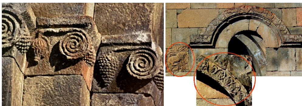
Ил. 1, 2. Орнаменты Птгнаванка. Fg.1, 2. Ornaments of Ptghnavank.

Комплекс Птгнаванк можно считать ярким примером использования орнаментов с символикой граната и винограда. Храм был построен в VI-VII веках и лишь частично сохранились северная стена полуразрушенного храма и восточно-купольная арочная часть южной стены. Благодаря этим сохранившимся участкам на сводах сохранившихся проемов и в верхних арочных обрамлениях входов можно увидеть отдельные и групповые композиции с элементами винограда и граната. Язык их художественного выражения суров и лаконичен (ил. 1, 2).