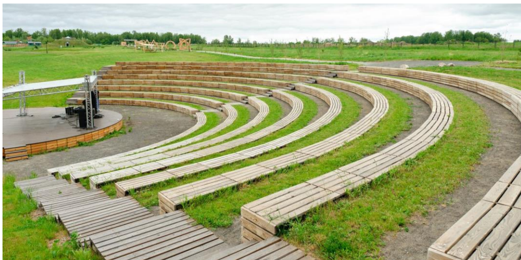
Ил. 4. Мира Парк [Мира Парк // Мира Деревня [Электронный ресурс] URL: https://miraderevnya.ru/infrastructure/park-complex ]