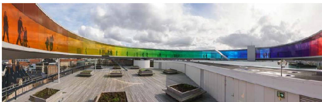
Ил. 2. Your Rainbow Panorama (Твоя радужная панорама) [Дутцев, 2021, с. 16.]