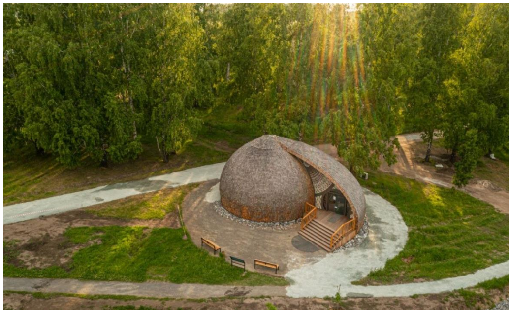
Ил. 3. Мира Парк [Мира Парк // Мира Деревня [Электронный ресурс] URL: https://miraderevnya.ru/infrastructure/park-complex ]

5. Роль энергетического наполнения ("аура и атмосфера). Парк направлен не на развлечения, а на медитацию, получение энергетического заряда.