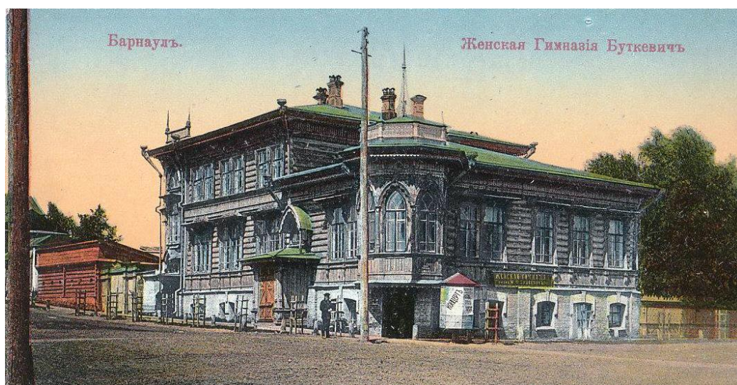
Ил. 3. Женская гимназия Будкевич. г. Барнаул, пер. Конюшенный/ул. Томская. Фото нач. XX в.

Fg.2. Budkevich Women's Gymnasium. Barnaul, per. Konyushennyi/ul. Tomskaya. Photo of the beginning of the 20th century.