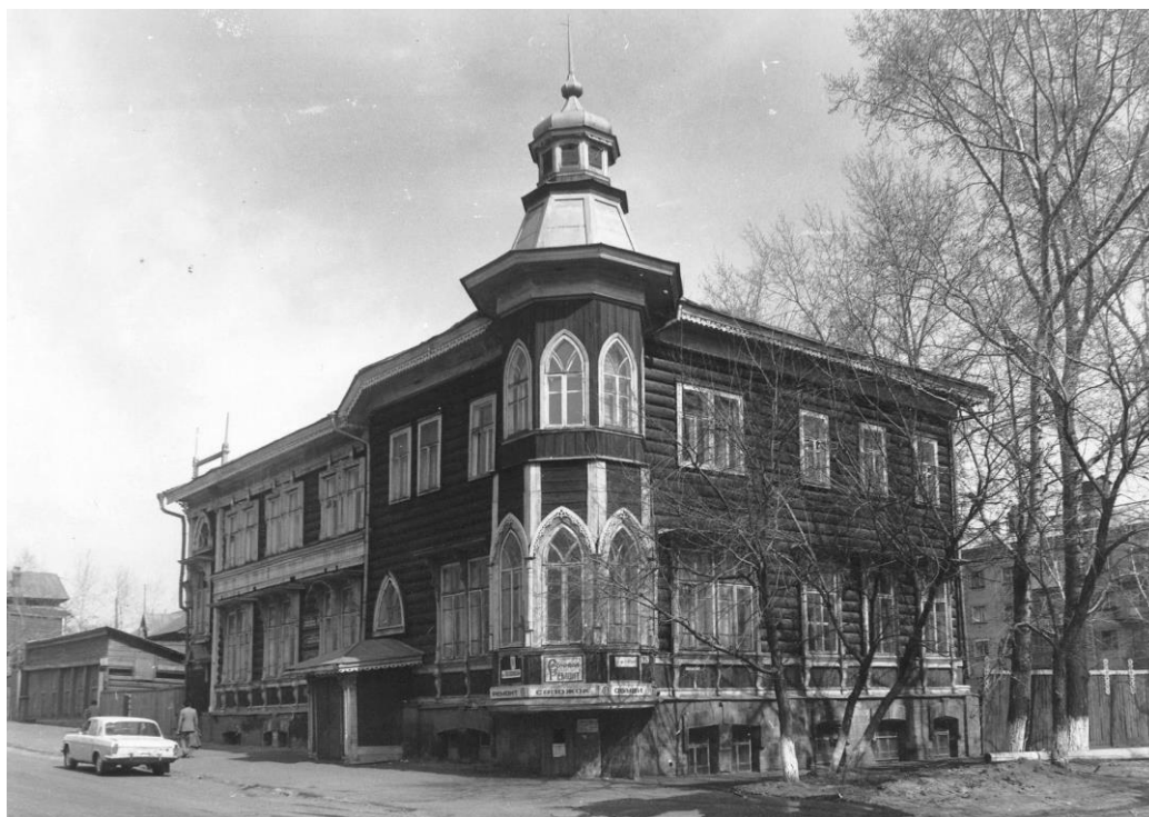
Ил. 4. Общий вид. г. Барнаул, пр. Красноармейский, 14/ул. Короленко, 96. Фото 1988 г.