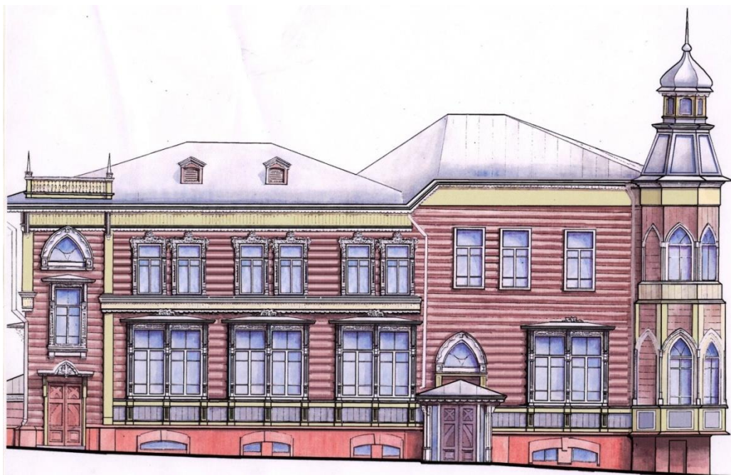
Ил.6. Цветовое решение юго-западного фасада. г. Барнаул, пр. Красноармейский, 14/ул. Короленко, 96. НПЦ «Наследие», арх. Е. Шаповаленко, 2004 г.