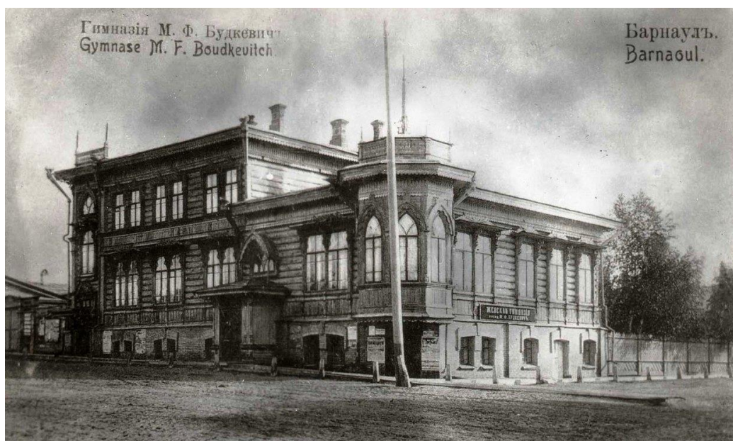
Ил. 2. Женская гимназия Будкевич. г. Барнаул, пер. Конюшенный/ул. Томская. Фото нач. XX в.

В классе разрешалось преподавать латинский язык и новые языки. Плата за обучение устанавливалась 10 рублей в месяц [ГААК, Ф.45. Оп.1. Д.38. Л.6] (ил. 3). Большие светлые помещения дома как нельзя лучше подходили под классы учебного заведения.