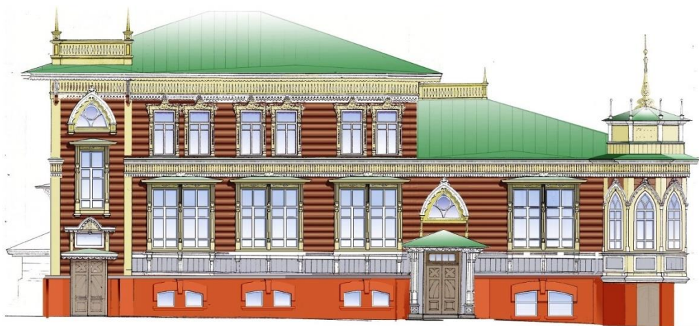
Ил. 5. Цветовое решение юго-западного фасада. г. Барнаул, пр. Красноармейский, 14/ул. Короленко, 96. НПЦ «Наследие», арх. Е. Шаповаленко, 2003 г.

В 2001 г. в здании были проведены мероприятия по устранению аварийной ситуации: замена рухнувшего участка перекрытия, усиление аварийных участков деревянных перекрытий 2 этажа, укрепление участков внутренних бревенчатых стен, усиление стены северного фасада. А также мероприятия по реставрации фасадов: частичная замена оконных блоков; реставрация тамбура входа с пр. Красноармейского. Сумма затрат по смете составила 360,7 тыс. руб. В 2002 г. специалистами НПЦ «Наследие» были выполнены обмерные чертежи, инженерное заключение и реставрационные работы по цокольному этажу. В 2003–2005 гг. — выполнен рабочий проект реставрации, цветовое решение фасада до надстройки второго этажа, продолжение реставрационных мероприятий в соответствии с принятыми проектными решениями, в т.ч. в 2003 г. — проект ремонта отопления, водопровода, канализации и вентиляции [ГААК, Ф.Р-1849. Оп.1. Д.660] (ил. 5), в 2004 г. — проект наружного (дворового) ливневого водостока и внутреннего пластикового дренажа, а также было выполнено цветовое решение фасада в современном виде [ГААК, Ф.Р-1849. Оп.1. Д.705] (ил. 6).