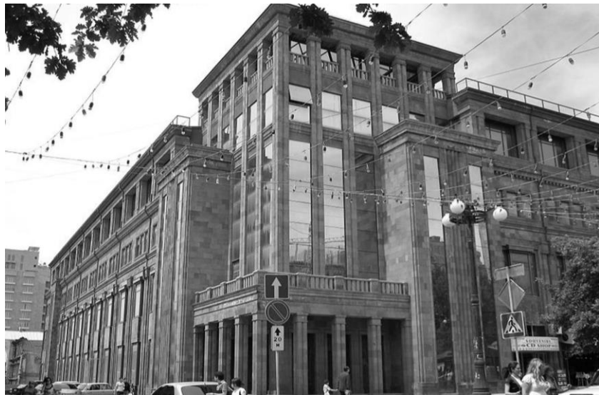
Ил. 4. Орнаменты Ахтамара, X в. Кюркчян А., Хачерян Г., Армянское искусство орнамента Fg. 4. Ornaments of Akhtamar, X c. Kyurkchyan A., Khacheryan H., Armenian Ornamental Art

Армянский модернизм говорил «да» традиционным идеям организации архитектуры и «нет» — ее традиционным формам [Бальян, 2010, с. 53–54]. Уже на первоначальном этапе авангардистами были спроектированы интереснейшие здания, значение которых выходило за границы исключительно армянской архитектуры. Это здания Клуба строителей в Ереване (ныне Русский драматический театр им. Станиславского и Олимпийский комитет Армении, (авт. К. Алабян, Г. Кочар, М. Мазманиян, Ереван, 1929–1931), «шахматного» дома (авт. К. Алабян, М. Мазманиян), кинотеатра «Москва» (авт. Т. Ерканиян, Г. Кочар, Ереван, 1931–1936), Центрального универмага (авт. Г. Кочаром, М. Мазманиян, А. Агаронян, О. Маркаян, Ереван, 1932–1937), Дома отдыха писателей на