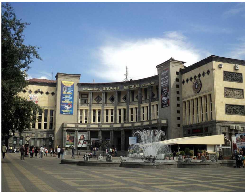
Ил. 3. Здание кинотеатра «Москва».