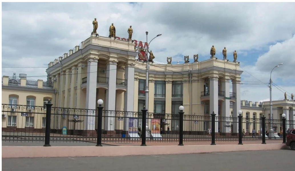
Ил. 6. Здание Вокзала города Воронежа, [ru.wikipedia.org] Fig. 6. The building of Train Station in Voronezh, [ru.wikipedia.org]

Подвергая резкой критике теорию и практику «неоармянского стиля», и учитывая тот факт, что армянский модернизм всецело одобрял местные традиционные идеи архитектуры, М. Мазманиян в то же время подтверждал необходимость изучения методов работы мастеров прошлого. По его мнению, архитектурные формы нельзя было выводить лишь из конструкции и строительного материала. Он считал, что интернациональные тенденции современной архитектуры должны получить различную национальную окраску в зависимости от конкретных бытовых и климатических условий и природного окружения [Мазманиян, 1928, с. 128–136]. При этом особое значение М.Мазманиян придавал традициям народного зодчества, противопоставляя их дворцово-культовой архитектуре прошлого. В таком духе архитектура авангарда активно развивалась, а влияние ее форм было настолько сильным, что ему поддался и неоклассик Н. Буниатян.