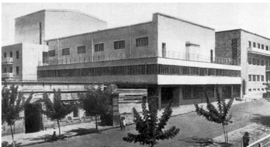
Ил. 2. Клуб строителей в Ереване (ныне Русский Драматический театр и Олимпийский комитет Армении).