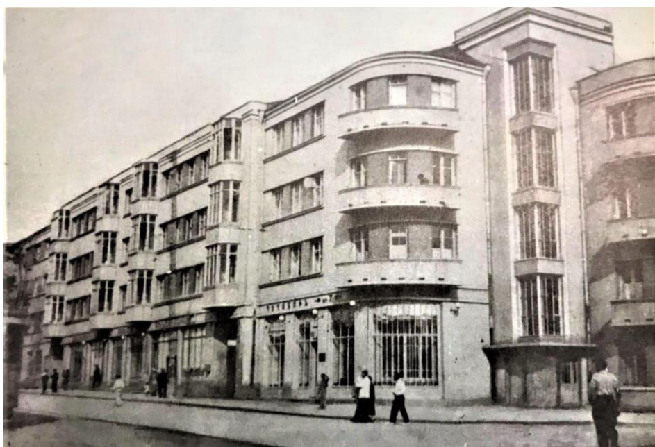
Ил. 1. Жилой район для рабочих завода Синтетического каучука (СК)

Это исходило из периода учебы М. Мазмания во ВХУТЕМАС, в середине 1920-х годов, когда в Армении складывалось течение «нео-армянский стиль», где основой творческой концепцией являлось стремление объединить местные традиционные архитектурные формы и декор с композиционными приемами классицизма (ил. 1, 2).