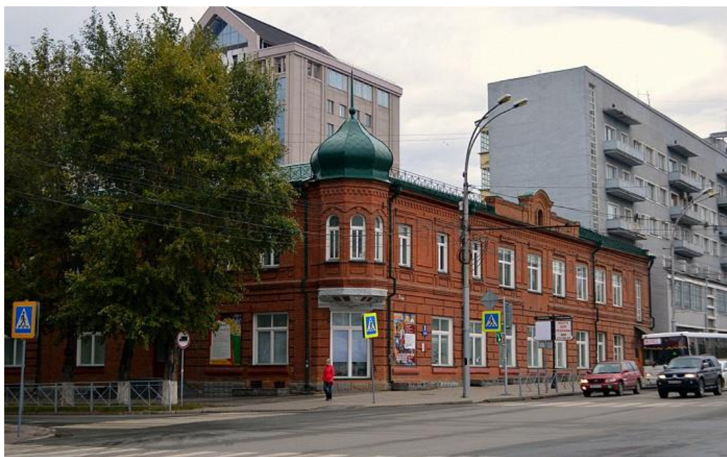
Ил. 2. Новосибирское государственное художественное училище (бывшее здание Дома Маштакова). г. Новосибирск, пересечении ул. Свердлова, 15 и ул. Красный проспект, 9.