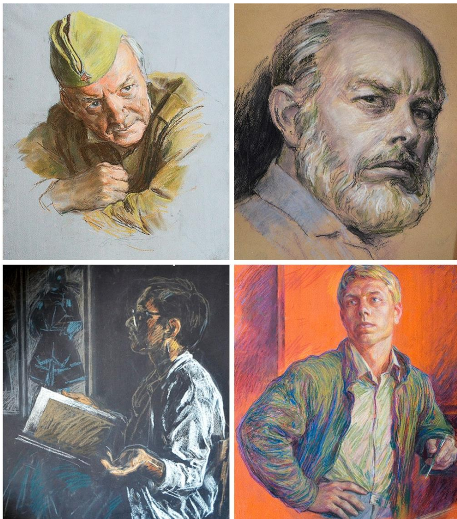
Ил. 5. Портреты современников в технике пастель. Автор: художник-монументалист А.С. Чернобров-цев. (URL: http://www.xn--90acajc9bhbd2ed.xn--p1ai/portrets.html )