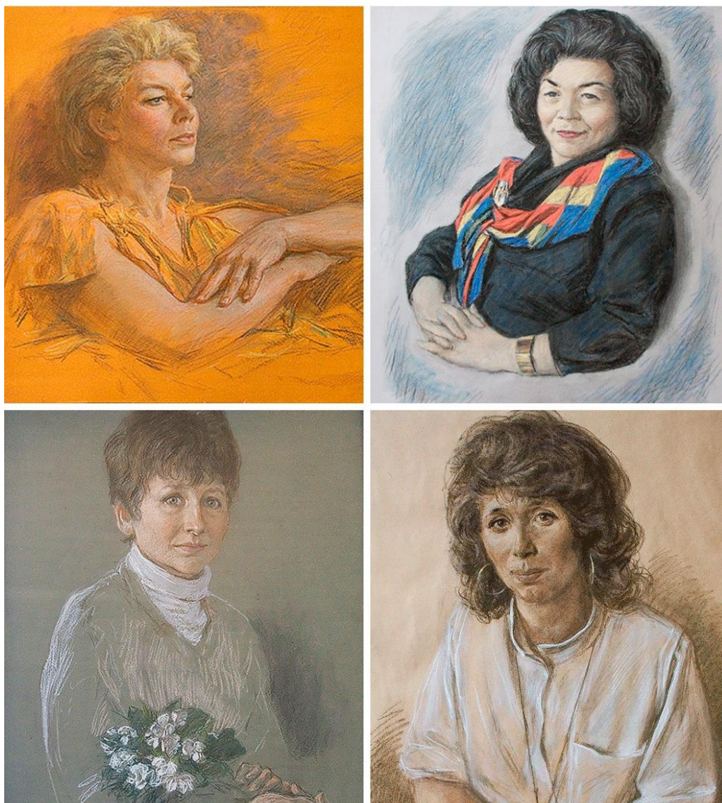
Ил. 4. Портреты современников в технике пастель. Автор: художник-монументалист А.С. Чернобровцев. (URL: http://www.xn--90acajc9bhbod2ed.xn--p1ai/portrets.html )