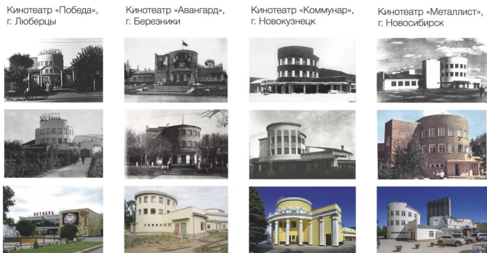
Ил. 2. Особенности жизненного цикла зданий звуковых кинотеатров в регионах. Иллюстрация автора. Fg 2. Features of the life cycle of sound cinema buildings in the regions. Author's illustration

В городе Березники и в Новокузнецке здание кинотеатра было признано объектом культурного наследия (местного значения) [Научно-проектная документация...]. В 2018 г. охранный статус получил и кинотеатр Металлист в Новосибирске. Основные этапы жизненного цикла объекта обозначены на схеме (Ил. 3).