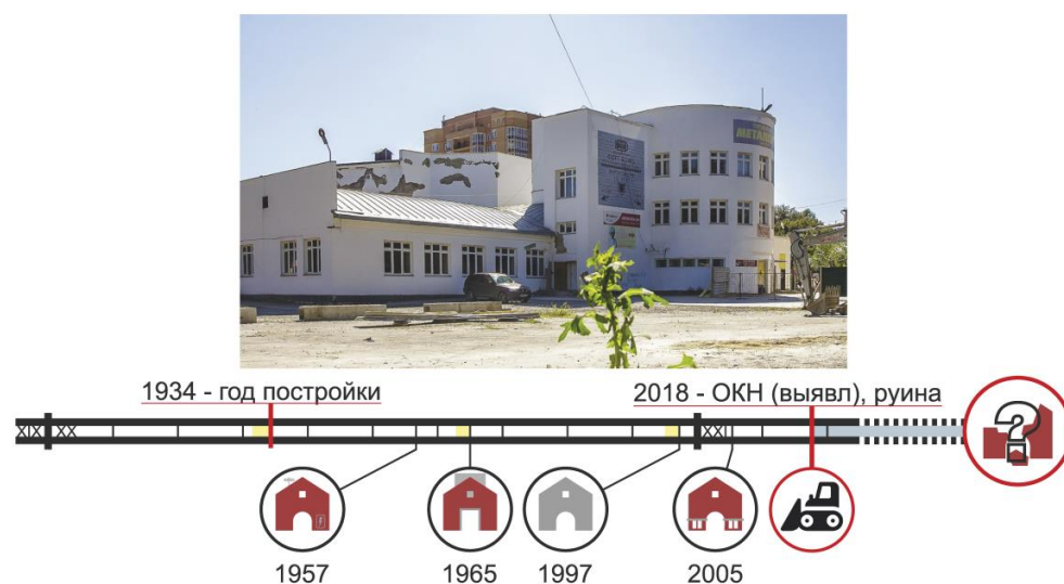
Ил. 3. Основные этапы жизненного цикла кинотеатра Металлист. Иллюстрация автора. Fg 3. The main stages of the life cycle of the Metalist cinema. Author's illustration.