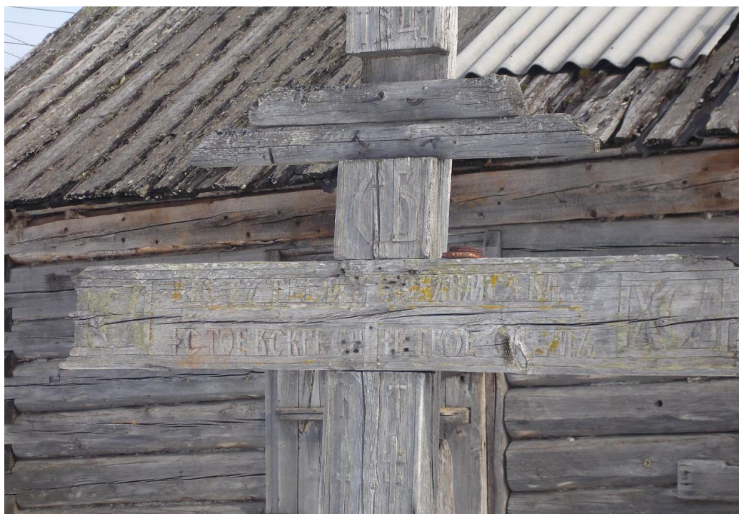
Ил. 5. Обетный крест, с. Дорогорское, Мезенский р., кон. XIX в.