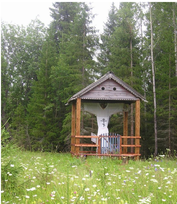
Ил. 4. Обетный крест, д. Березник, Мезенский р., кон. XIX в.

Fg. 3. Foundation pillar of the village of Bereznik, Leshukonsky district, 1879.