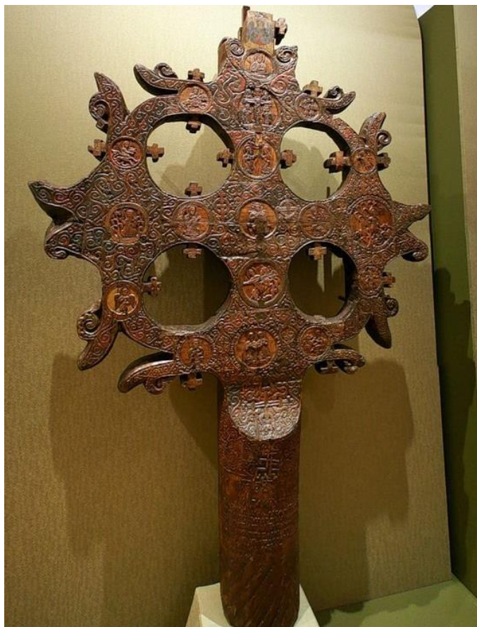
Ил. 2. Людогощинский крест в Великом Новгороде, 1359. [Электронный ресурс] URL: www/http://artifact.org.ru (дата обращения 18.05.2022)