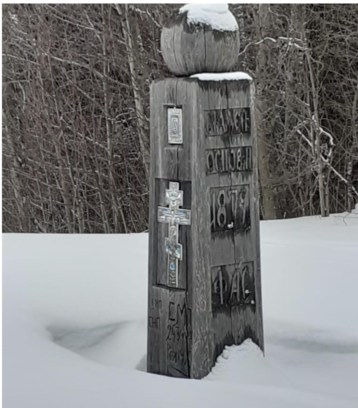
Ил. 3. Столб основания д. Березник, Лешуконского р., 1879.

Fg. 3. Foundation pillar of the village of Bereznik, Leshukonsky district, 1879.