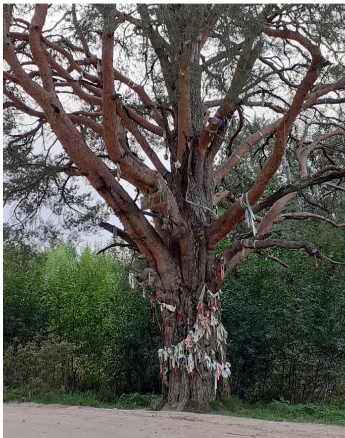
Ил. 1. Придорожная сосна по дороге в с. Поча, Плесецкий, Национальный парк «Кенозерский».