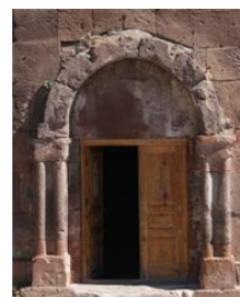
Мастара, VI в. Mastara, 6 c.