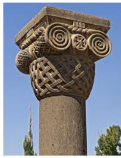
Храм Звартноц, VII в. Temple Zvartnots, 7 c.