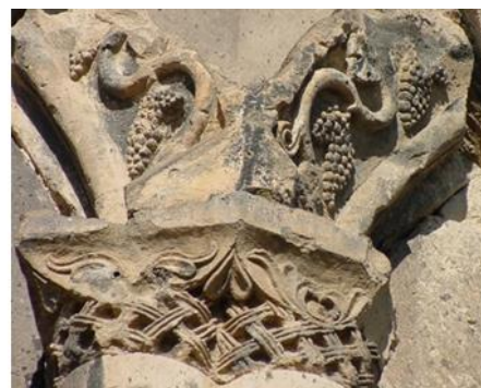
Талин, VII в. Talin, 7 c.