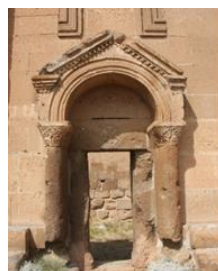
Ереруйк, V-VI вв. Yereruk, 5-6 c.

В раннехристианских церковных зданиях важную роль играют порталы своими архитектурными формами, с разнообразным декоративным убранством, активно участвуя в достижении художественной выразительности этих сооружений. По обеим сторонам входного проема размещены пилястры, на которых опирается арка, акцентированная фронтоном (Звартноц, Ереруйк, Касах, Аван, Аруч, Мастара, Рипсима и др.). Решение порталов церквей с наружными галереями такое же, но без фронтона (западный фасад Ереруйка, храмы Текор, Одзун и др.) [Азатян, 1987, с. 9–12]. Согласно сохранившимся фрагментам и проекта реконструкции Т. Тораманяна, пять входов собора Св. Григория в Звартноце относятся к первому типу (ил. 1).