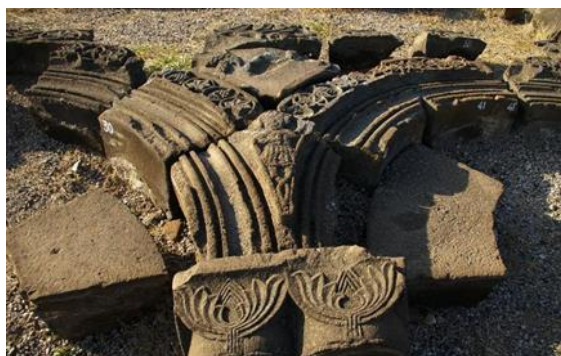
Звартноц, VII в. Zvartnots, 7 c.

вый орнамент», в разных интерпретациях использовавшийся в эллинистическом периоде как в греко-римской, так и в армянской архитектуре. Позже этот мотив с различными вариантами можно увидеть на многих раннесредневековых памятниках (Зоравор, Сисиан, Бюракан, Птгни, Аруч и др.). Во второй половине VII в. в наружном оформлении фасадов и барабанов некоторых церковей важную роль играли пилястры с парами колонн и декоративными аркадами (Звартноц, Артик, Талин, Воскепар, Сисаван и др.). Грани Звартноца украшены арками с декоративными двойными колоннами, капители которых имеют принятый в декоративном искусстве мотив «пары цветов». Этот орнамент, имеющий глубокие корни в миниатюрной живописи, символизирует значение родительской пары. В убранстве Звартноца он тоже символичен, выступает как символ плодородия, зарождения новой жизни. Влияние Звартноца заметно на изящном и роскошном орнаменте капителей колонн апсиды большой церкви Талина (VII в.). Они состоят из прямоугольного объема «корзинно-плетеной полусферы» квадратной формы, на котором размещен мотив орнамента «пары цветов» (ил. 8).