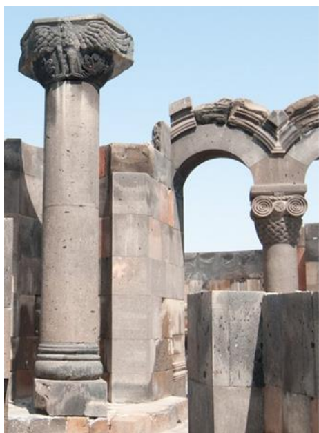
Ил. 9. Капители храмов раннехристианского периода Fg. 9. Capitals of temples of the early Christian period