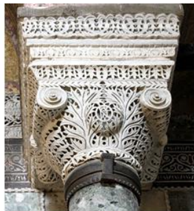
Храм Святой Софии в Константинополе, VI в. Temple St. Sophia in Constantinople, 6 c.