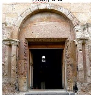
Одзун, VI в. Odzun, 6 c.