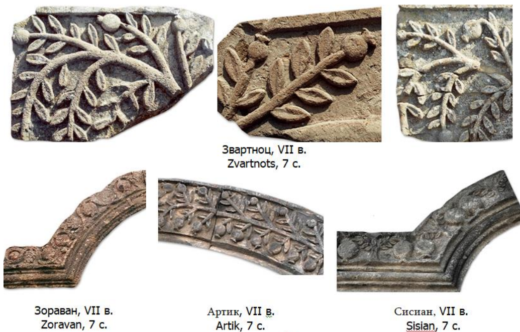
Ил. 6. Орнаментальный мотив граната Fig. 6. Ornamental pomegranate motif

половины VII в. (церкви Егварда, Артика, Талина). В декоративной скульптуре этих сооружений очевидно влияние «звартноцской гранаты» (ил. 6). Капители и венцы оконных проемов церкви Св. Геворка в Артике украшены различными орнаментами: виноградная лоза, гранат, пальмовые листья и т. д. Виноградно-гранатовый орнамент присутствует и в архивольтах оконных арок Зораворской церкви в Зораване. Подобный орнаментальный пояс имел и храм Банак в Тайке, построенный по образцу храма Звартноц.