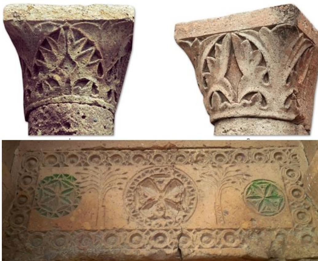
Ил. 2. Капители и тимпан южного портала Ереурикской базилики Fig. 2. The capitals and tympanum of the south portal of the Yereruk Basilica

арочным проемом, а два южных — увенчаны треугольным фронтоном. Скульптурный орнамент капителей 3/4 круглых пилястр оформлен растительными мотивами акантовых листьев. Капители порталов Ереурик базилики оформлены двумя симметрично расположенными акантовыми листьями. Каждый из них имеет трехлиственную композицию, оси центральных листьев направлены в сторону углов абака. Два акантовых листа каждого орнамента соприкасаются спереди, а два других — поворачиваются в сторону боковых фронтов капители, создавая единое целое (ил. 2). Прямоугольные тимпаны дверных проемов оформлены скульптурными орнаментами, растянутыми по всему периметру в скульптурный пояс. На них размещены розетки с раннехристианскими равнокрылыми крестами, шестилепестковыми цветочными орнаментами, древами жизни и парой зооморфных скульптур (ил. 2). Порталы, имеющие перекрытия в виде фронтона, завершаются профилированными карнизами. Для профилировки применялись полки, валики и выкружки, дополненные зубцами. Наиболее характерным примером являются карнизы на порталах Ереурикской базилики. Порталы других раннесредневековых церквей (Касах, Егвард, Аван) также заканчиваются подобными зубчатыми карнизами.