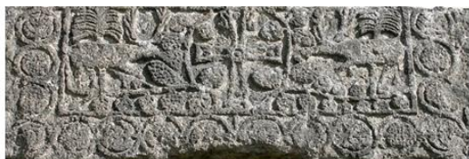
Западный тимпан Касахской базилики (IV–V вв.) Western tympanum of the Kasakh basilica (4–5 cc.)

характерной чертой самобытности армянской культуры. В центре композиции орнаментального убранства западного тимпана Касахской базилики (IV–V вв.) равнокрылый крест, две стороны которого украшены зооморфными фигурами с пальмовыми ветками и виноградными гроздьями (ил. 4).