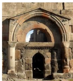
Аван, VI в. Avan, 6 c.