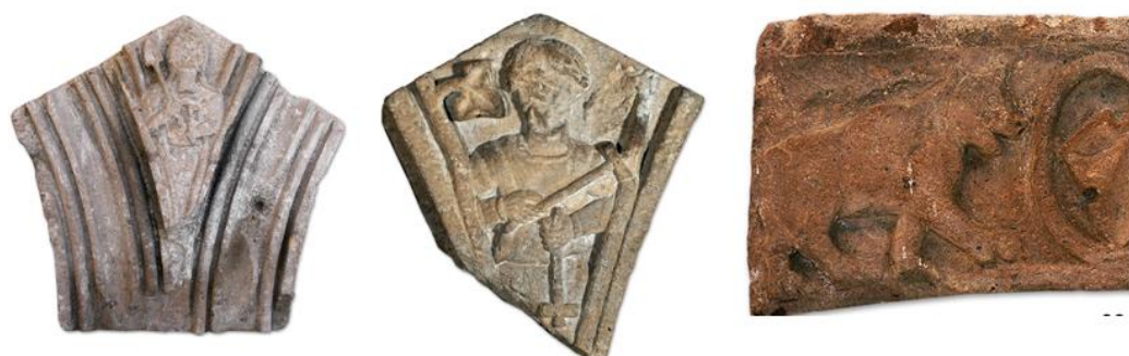
Ил. 7. Звартноц. Скульптуры людей и медведя Fig. 7. Zvartnots. Sculptures of peoples and bear

тридцати двух). Существует два мнения по поводу интерпретации этих скульптур: они либо строители-мастера храма, либо заказчики сооружения. На одном из них есть надпись на армянском языке «Յոանն» («Йоанн»), что предположительно является именем архитектора. Интересно, наиболее хорошо сохранившаяся скульптура человека с характерным головным убором, указывает на то, что последний, вероятно, имел духовный сан (ил. 7).