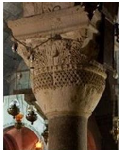
Храм Святого Воскресения в Иерусалиме, V в. Temple of the Holy Resurrection in Jerusalem, 5 c.

Уникальны орлиные капители Звартноца, венчающие четыре колонны, стоят по углам абсид и поддерживают восемь арок. Орлы с открытыми крыльями, словно паря, гордо несут всю тяжесть конструкции храма (ил. 10).