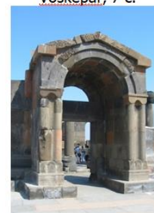
Звартноц, VII в. Zvartnots, 7 c.