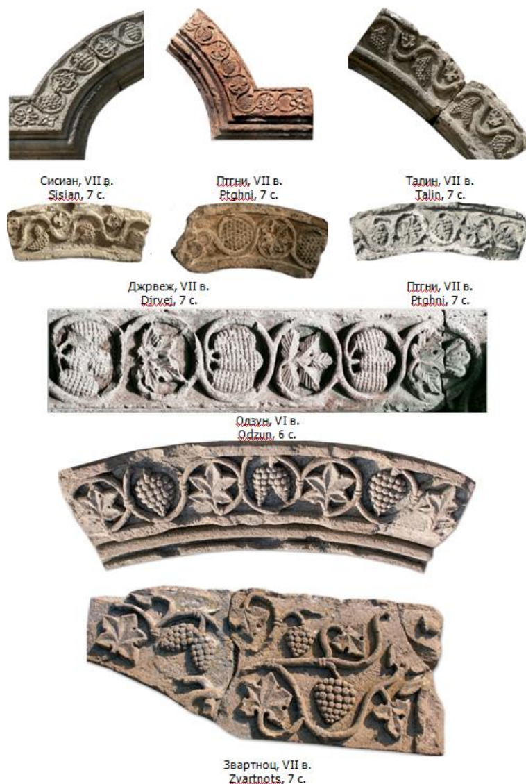
Ил. 5. Орнаментальные мотивы винограда Fg. 5. Ornamental grape motifs

венного оформления, что придавало храму роскошную декоративность. В этом сооружении сочетались и синтезировались различные искусства: архитектура, скульптура, мозаика. Об этом свидетельствуют многочисленные скульптурные фрагменты, оставшиеся от некогда славного храма. Часть равнокрылого креста от сохранившейся цветной мозаики говорит о том, что мозаики были достаточно роскошны и красочны гармонично величественному образу сооружения.