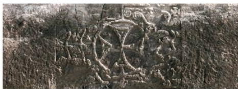
Западный тимпан базилики Циранавор в Аштараке (V в.); Western tympanum of the Tsiranavor Basilica in Ashtarak (5 c.)