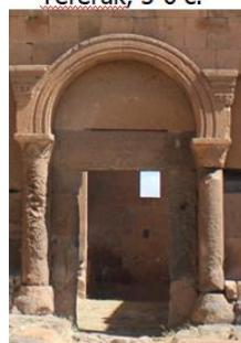
Ереруйк, V-VI вв. Yereruk, 5-6 c.