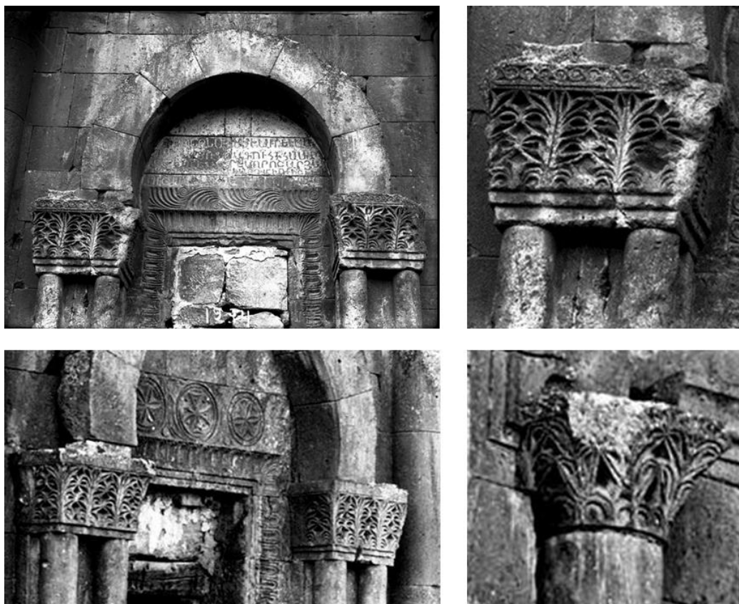
Ил. 3. Порталы и капители Текорской купольной базилики, VI в.

абакой, оформленной плетеным орнаментом. Поверхности капителей выполнены рельефом акантовых ветвей: посередине два полных, а по краям половинки, вторые полуветви которых поворачиваются на боковые грани. Следует отметить, что свое второе возрождение храм Текор пережил в XX веке, в творчестве основоположника советско-армянской архитектуры Александра Таманяна и в произведениях последователей талантливого архитектора. Декоративные пилястры и капители многих зданий этого периода повторяют композицию и орнаментацию текорского капителя, конечно же, с творческим переосмыслением.