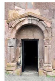
Воскепар, VII в. Voskepar, 7 c.