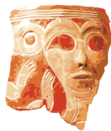
ИАЭТ СО РАН