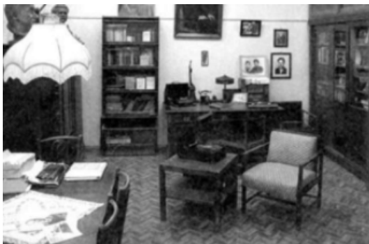
Рис. 2. Обстановка квартиры 1930-х гг. [Музей «Дом на набережной», г. Москва ул. Серафимовича, 2]

В это время были сформулированы требования к проектированию мебели, которые диктовали определенные принципы разработки и производства предметов: габариты, которые должны были соответствовать вещам, хранящимся в мебели, соотношение отдельных частей мебели с антропометрическими данными, габариты также соотносились с жилым пространством, планировкой квартиры, учитывалась возможность легкой транспортировки и перестановки мебели [2]. С одной стороны, сложно назвать мебель, в основу которой легли конструктивистские и рационалистические идеи, особенно легкой и компактной, с другой стороны, мебель соответствовала назначению и декор отдельных элементов конструкции не препятствовал эффективному использованию отдельных предметов (рис. 2).