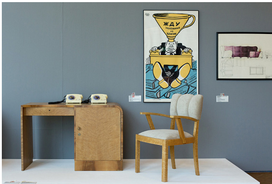
Рис. 3. Комплект мебели 1950-х гг. Рига, Поммердам, 2015 г.

Сложно отнести проекты 1950-х гг. к стилю постмодернизм, однако эти проекты наглядно демонстрируют переход к новому течению, к новым принципам создания проектов и новым принципам формообразования. Один из примеров – мебель, изготовленная в Риге (рис. 3).