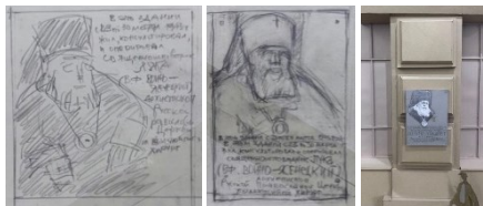
Ил. 5. Эскизы мемориальной доски Луке Войно-Ясенецкому.

В Новосибирском государственном университете архитектуры, дизайна и искусств имени А.Д. Крячкова разрабатывались эскизы мемориальной доски, посвящённой Луке Войно-Ясенецкому (ил. 5).