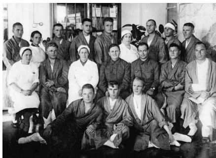
Ил. 3. Пациенты и медики госпиталя № 1504 (во втором ряду первая слева В.Н. Терешкова). Источник: [2, с. 92].

делом, но благодаря колоссальному труду профессоров это разница в количестве штатных врачей была незаметна [5, с. 15].