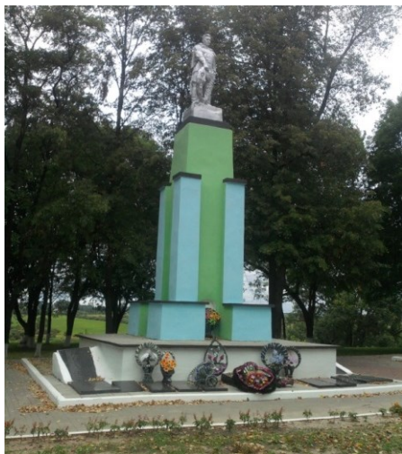
Ил. 9. Братская могила на Замковой горе в г. Чечерске

Из сотен и тысяч свидетельств, документов, фактов злодеяний фашистских оккупантов на белорусской земле складывается общая картина народной трагедии белорусов, то, что мы называем геноцидом белорусского народа. В народной памяти новых поколений белорусов эта трагедия будет оставаться до тех пор, пока они будут знать о фактах геноцида не только в нашей республике, но и на их малой родине по отношению к их предкам.