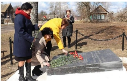
Ил. 8. Памятник сожженным деревням в д. Репище

людей без разбора. Трупы не закапывали, а ради забавы по ним ходили, даже по маленьким телам грудных деток. От дикого крика женщин, детей, стариков можно было сойти с ума. Тогда было убито около пяти-сот человек из разных деревень. Остальных они погнали в неизвестном направлении. На тех, кто с трудом мог передвигаться, враги безжалостно натравливали собак. Одному старику, который с трудом передвигался, сначала, отрубили кисть руки, а потом выстрелом в голову убили.