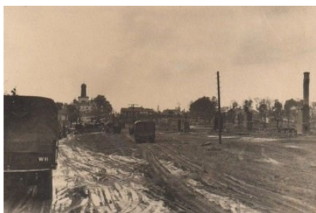
Илл. 7. Вид Чечерска в годы оккупации

Из 130 населенных пунктов района фашисты полностью сожгли 14, частично – 56, сожжено и разрушено 3 169 подворий. В Чечерске оккупанты сожгли около трехсот домов. За период оккупации 1 226 мирных