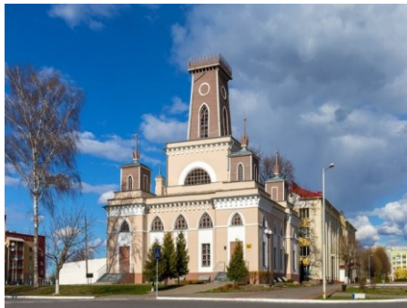
Ил. 5. Современный вид ратуши в г. Чечерске

Сразу после оккупации Чечерского района немецко-фашистскими захватчиками начались грабежи и массовые расстрелы. Зверства чинились в отношении всех, кто помогал партизанам, членов их семей также убивали.