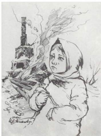
Ил. 5. «Осиротела»

тизаны в брянских лесах» (1943 г.), «Бойцы» (серия набросков) (1942 г.) (Ил. 6), «Пленный немец» (1944 г.), «Снаряжение гитлеровцев» (1944 г.) и т. д. [3]. Во время войны он писал работы, которые тематически не относились к войне. Например, открытка сыну и дочке в честь 25 летия октября (Ил. 7).