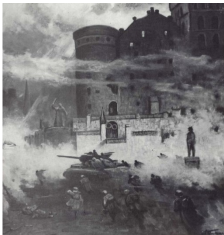
Ил. 8. «В штурме Кенигсберга»