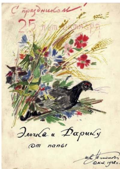
Ил. 7. Открытка