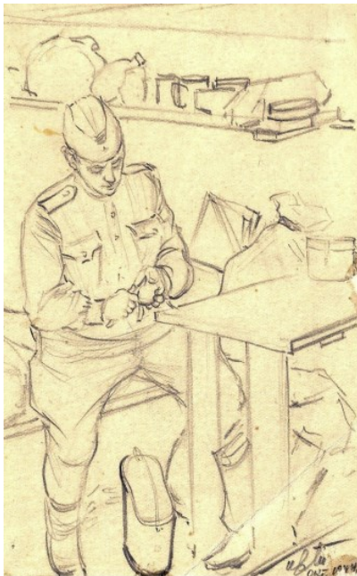
Ил. 6. «Бойцы» (серия набросков)