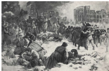
Ил. 2. «2-е февраля 1943 г. в Сталинграде»

В послевоенные годы художник дальше продолжил писать картины, которые отображали Великую Отечественную войну. В 1947 г. он представил работу «2-е февраля 1943 г. в Сталинграде» (Ил. 2), которая в дальнейшем станет одной из самой узнаваемой из его работ.