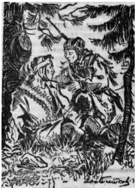
Ил. 3. Зарисовка в газете «Советская Сибирь»