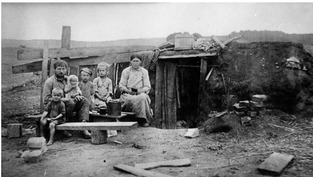
Рис. 2. Семья строителей (землекопов-грабарей) Кузнецкого металлургического комбината у своего жилища. Фотография 1929–1932 гг. [12]

Отмеченные нами противоречия между изображением, текстом и стоящими за последним мечтами рабочих Кузнецкстроя, отражают стремительное изменение представлений об архитектуре того времени. Характерная черта эпохи: архитектурная идея в стихотворении Маяковского начинает жить своей особой жизнью, приобретает самостоятельную ценность, куда более значимую для рабочих