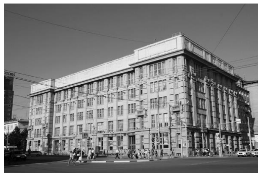
б) После реконструкции. [9]