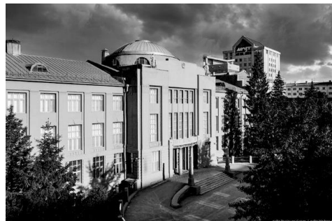
Рис. 2. Здание Сибревкома. [8]

Другую работу мастера – здание Сибкрайсоюза (1926 г.) – можно рассматривать как синтез форм неоклассицизма и модерна. Симметричные фасады унаследованы от неоклассики, при этом большие оконные проемы имеют черты рационального модерна начала XX в.