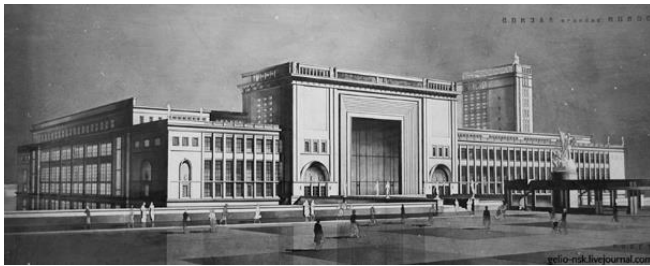
а) Проект реконструкции середины 1930-х гг. [4]

Целый ряд новосибирских зданий, первоначально запроектированных как авангардистские, во второй половине 1930-х гг., в ходе достройки или реконструкции, получили неоклассическую стилистику. Один из примеров – железнодорожный вокзал «Новосибирск-Главный», проектный облик которого неоднократно менялся. Первый вариант был разработан архитектором Н.Г. Волошиновым в предельно упрощенных конструктивистских формах (1929 г.). Затем Киевское отделение Гипротранса запроектировало конструктивистское здание с обильным остеклением (1931 г.). Затем проект дорабатывался группой архитекторов под руководством Б.А. Гордеева: это был один из первых образцов постконструктивизма (проект середины 1930-х гг.). В конце 1930-х гг. был объявлен конкурс на разработку нового проекта архитектурного оформления. В 1939 г. реконструированное здание вокзала, получившее неоклассическую трактовку, было, наконец, принято в эксплуатацию (рис. 5).