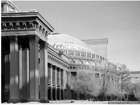
а) Новосибирский театр оперы и балета. Современное фото [6]