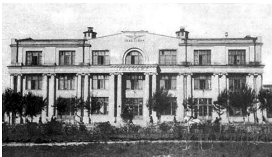
Рис. 1. Здание Сибдальгосторга. Фото 1920–1930-х гг. [7]

построенные по его проектам неоклассические здания Сибдальгосторга (1923 г.) и Сибревкома (1926 г.). Симметричная объемно-пространственная композиция и лаконичный декор отсылают к первоисточнику – неоклассицизму. Но если в первом случае мотивы классицизма выражены более ярко (благодаря полуколоннам ионического ордера и массивному карнизу), то второму объекту колорит «красной дорики» придают упрощенные пилястры и агитационные скульптуры – фигуры рабочего и крестьянина (рис. 1, 2).