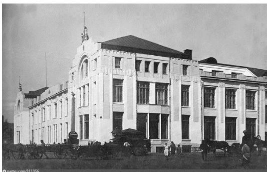
а) До реконструкции. Фото 1920–1930-х гг. [3]

Подход, основанный на синтезе рационального модерна и неоклассики, А.Д. Крячков применял в большинстве своих проектов 1920-х гг. Его первоначальный проект здания Госучреждений имел в оформлении фасадов и интерьеров черты рационального модерна и неоклассики. Особый интерес вызывают дорические колонны в залах первого этажа. Колонны имеют упрощенные, «архаизированные», капители. В 1933–1937 гг. здание было надстроено до пяти этажей и реконструировано. Фасады были украшены классицистическим декором. В настоящее время здесь располагается Новосибирский государственный университет архитектуры, дизайна и искусств (НГУАДИ), который с 2019 г. носит имя отца-основателя архитектурного образования в Сибири – А.Д. Крячкова и является наглядным учебным пособием по советской неоклассике (рис. 3).