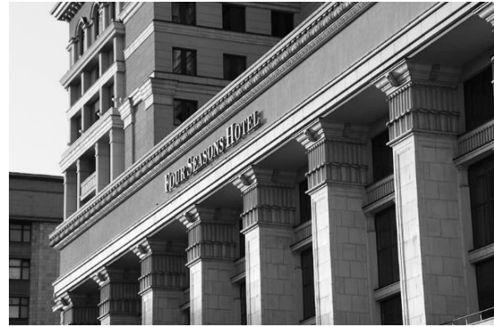
б) Гостиница Моссовета (г. Москва). [9]