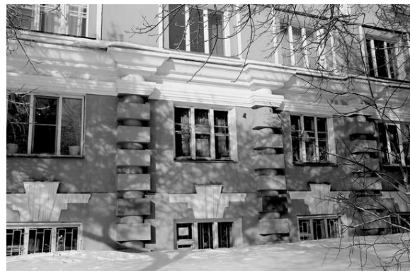
б) Здание 1930-х гг. по ул. Урицкого, 37 в г. Новосибирске. [9]