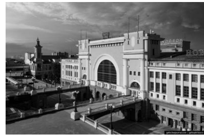
б) Реализованный проект 1939 г. Современное фото [8]